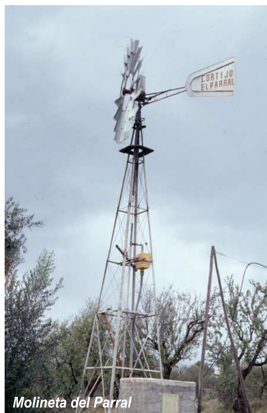
Molineta del Parral